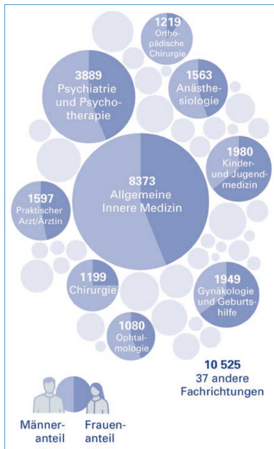
Abbildung 1: Ärztinnen und Ärzte nach Fachrichtung (Hauptberufstätigkeit) 2020. Detaillierte Zahlen zu den Fachgebieten sind unter www.fmh.ch → Themen → Ärztstatistik → FMH-Ärztstatistik aufgeführt.

Das Arbeitspensum der Ärztinnen und Ärzte betrug 2020 durchschnittlich 8,5 Halbtage pro Woche (1 Halbtage = 4–6 Std.), was einer Wochenarbeitszeit von 47 Stunden 1 entspricht. Mit 1,3 Halbtagen ist der Unterschied der Arbeitspensum von allen untersuchten Bereichen zwischen Männern und Frauen am deutlichsten (Frauen: 7,7 Halbtage, Männer: 9,0 Halbtage, Tab. 2).